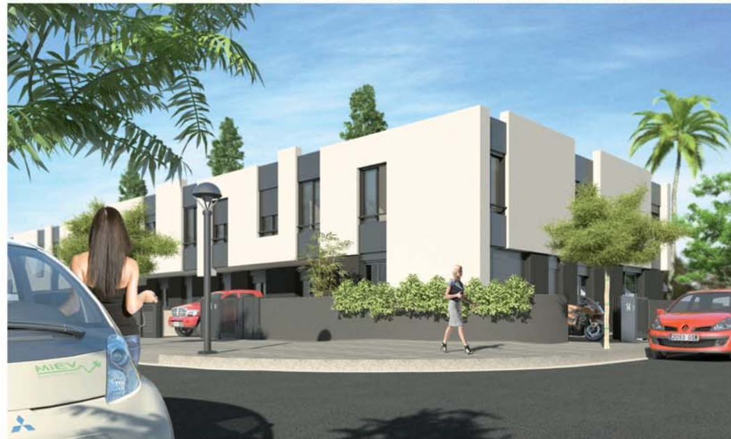
Imatge virtual no contractual